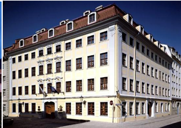
Hotel Bülow Residenz