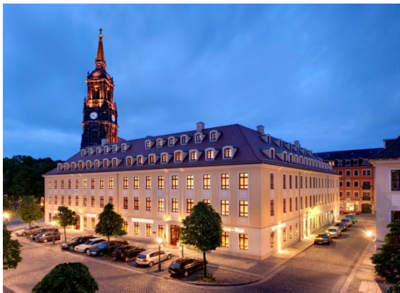
Relais & Chateaux Bülow Palais